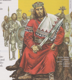
Kníže Sámů vytvořil první „stát“ na našem území